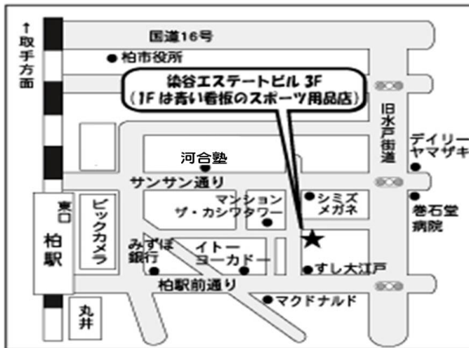
(東関東支部柏事務所) 柏市柏2-6-17染谷エステートビル3F